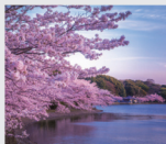
3-4月/ 明石公園 剛ノ池(兵庫)