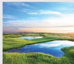
7-8月/ 月山弥陀ヶ原湿原(山形)