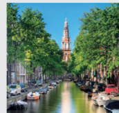
3-4月 アムステルダム/オランダ