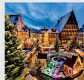
11-12月 ヒルデスハイム/ドイツ