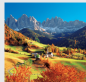
9-10月 ドロミーティ/イタリア