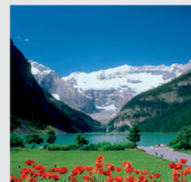
5-6月 レークローイズ/カナダ