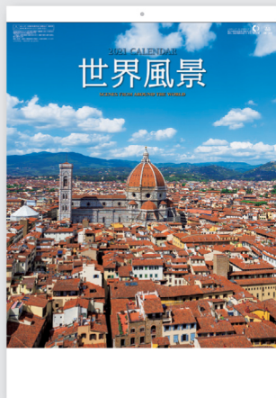
フィレンツェ/イタリア