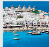
7-8月 ミコノス島/ギリシャ