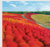
9-10月 国営ひたち海浜公園のロシア/茨城