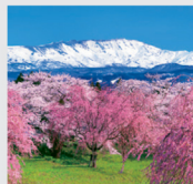
3-4月 馬渡の桜と月山/山形