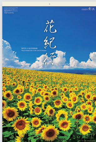
士別市のヒマワリ畑/北海道