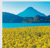
1-2月 菜の花咲く池田湖と開聞岳/鹿児島