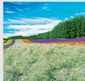
7-8月 ファーム富田のカスミンウ/北海道