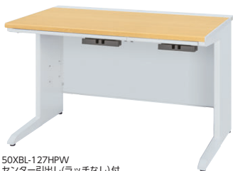
50XBL-127HPW センター引出し(ラッチなし)付