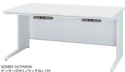
50XBH-167HWW センター引出し(ラッチなし)付