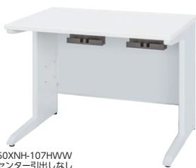
50XNH-107HWW センター引出しなし