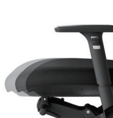
座前後調節 11mmピッチ、7段階