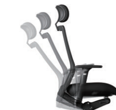
シンクロロック機構