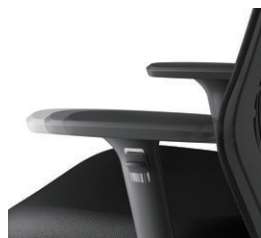
肘前後調節 5mmピッチ、13段階