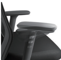
肘角度調節 ±30° 肘高さ調節 11mmピッチ、10段階