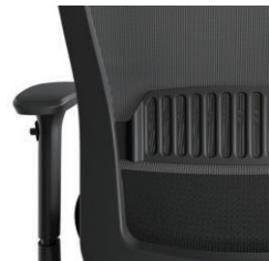
ランバーサポート機構 8mmピッチ、7段階