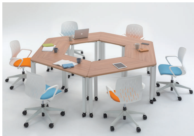
セット写真のテーブル NTS-1360TCNW