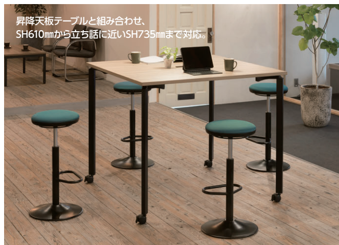
セット写真のテーブル OYTN-C1212HTC-LCK