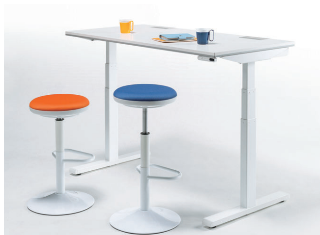
セット写真のデスク FNL-D167HWW