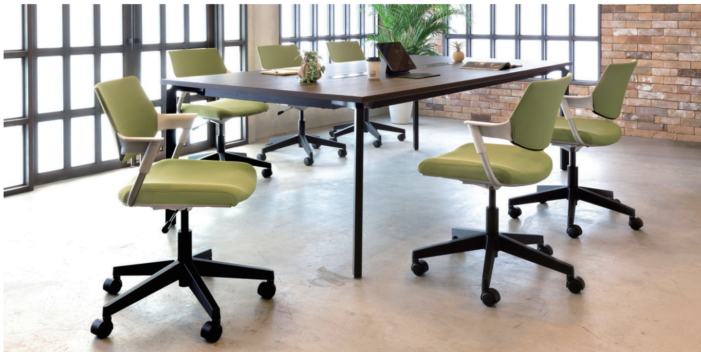
セット写真のチェア MCY-29KF-M(グリーン)、テーブル OYTN-B2412AY-DCK