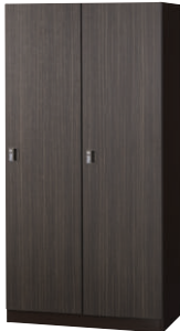
② SLJ-2WN-TNBR W900×D515×H1800 1室内寸/390×440×1685 ●53kg