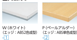
W (ホワイ) (エッジ: ABS2色成型) -1 P (ペールアルダー) (エッジ: ABS単色成型) -2