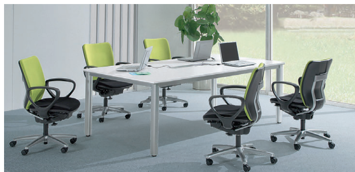
セット写真のテーブル FNM-2111TCW、チェア BC-2000F-LM+BC-100A チェア P219