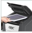
(用紙をセットして自動細断)