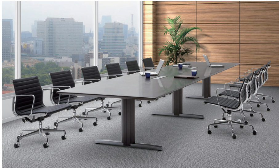
セット写真のテーブル ATN-4812W-D (ダークブラウン)、チェア TEA335VDLL2109 チェア H198