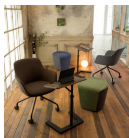
チェア・スツール P323