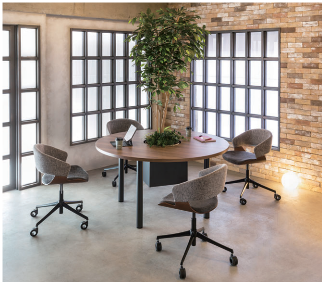
写真のチェア MCK-214CLCKF-LGG 写真のオフィスグリーン 508F500