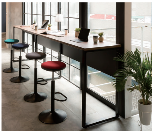
写真のテーブル TKH-1845AK-M+TKH-1845BK-M チェア P325

天板・天板厚/メラミン化粧板、パーティクルボード、29mm 天板エッジ/ABS樹脂 本体/スチール、粉体塗装(ブラック) アジャスター付