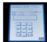
暗証番号入力(タッチ) 読み取り防止の番号表示 切替機能