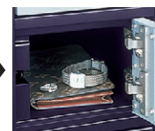
自動的に扉が開きます。