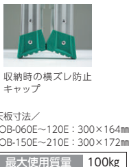
天板寸法/ JOB-060E~120E: 300×164mm JOB-150E~210E: 300×172mm