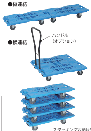
スタッキング収納状態

36-0045-0 JC-150H ¥5,700 W430×D26×H655 材質/スチール・グレー焼付塗装