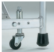
移動に便利なスプリングキャスター(φ40)付