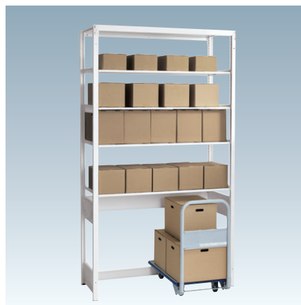
※抗菌剤は含まれていません。