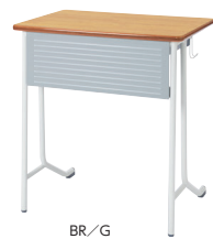
BR/G (ゴム集成材柄/ライトグレー)