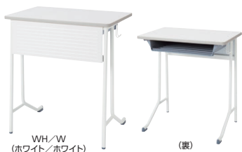
WH/W (ホワイト/ホワイト)