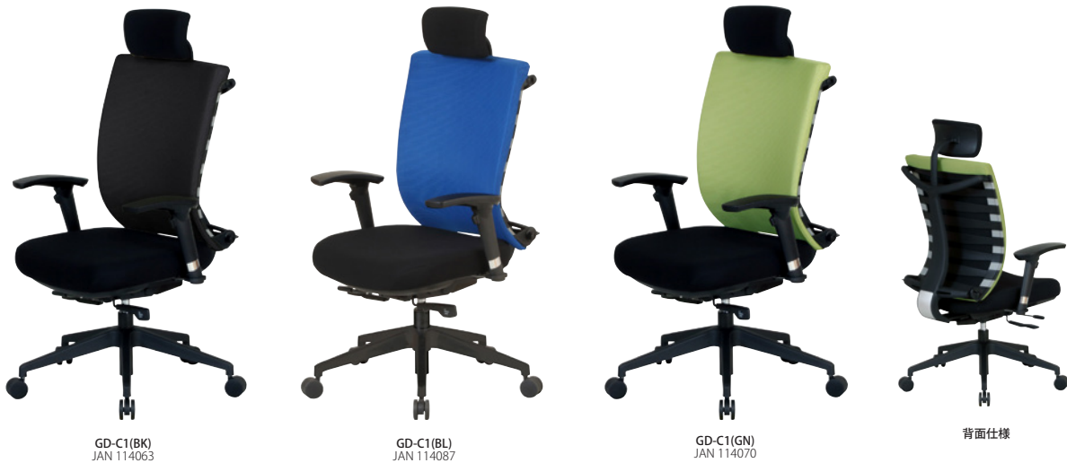
GD-C1(BK) JAN 114063