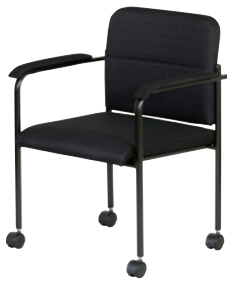
シェラB(肘付・キャスター付)(BK) ブラック