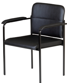
シェラB(肘付・BK) ブラック