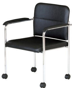
シェラ(肘付・キャスター付)(BK) ブラック JAN 050767