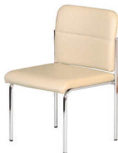
シェラ(肘なし)(IV) アイボリー JAN 050750