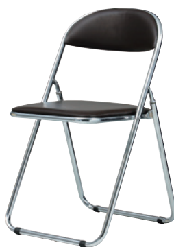
SFC-2M(BR) ブラウン JAN 054338