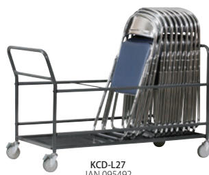
KCD-L27 JAN 095492