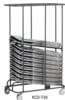
KCD-T30 JAN 095508