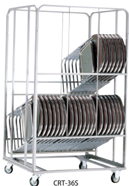
CRT-36S JAN 084465