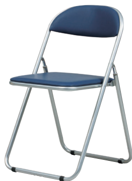
SFC-2T(BL) ブルー JAN 054307