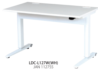
LDC-L127W(WH) JAN 112755