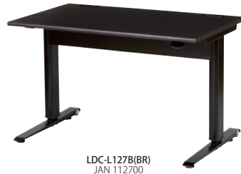
LDC-L127B(BR) JAN 112700