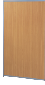
SMP-1509MP(NA) ナチュラル JAN 054475