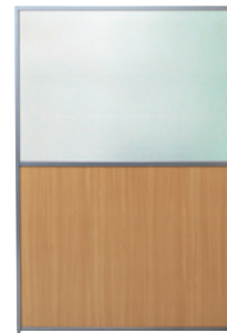
SMP-U1812(NA) ナチュラル JAN 131909