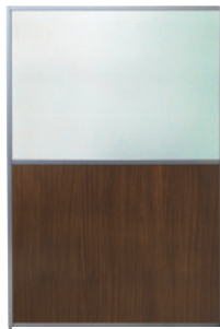
SMP-U1812(WT) ウォールナット JAN 131916