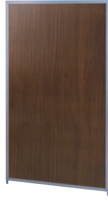
SMP-1509MP(WT) ウォールナット JAN 054482