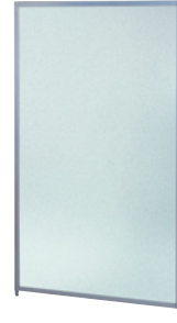
SMP-1509PC(CR) クリアーフロスト JAN 054499