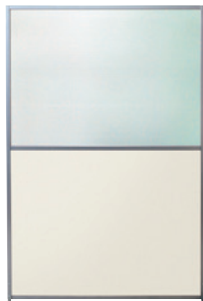
SMP-U1812(IV) アイボリー JAN 131893