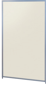
SMP-1509MP(IV) アイボリー JAN 078808