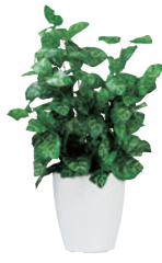
G-PK JAN 085806