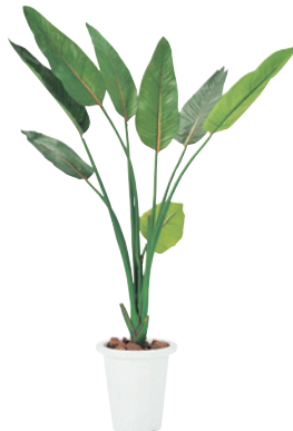
G-S JAN 085813