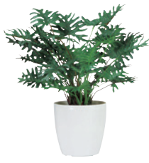
G-SP JAN 085820