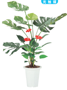
G-MS JAN 085790