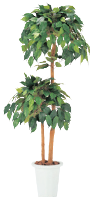
G-B JAN 085776