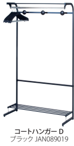
コートハンガー D ブラック JAN089019