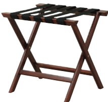
RKW-455 JAN 104903