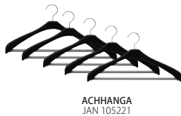
ACHHANGA JAN 105221