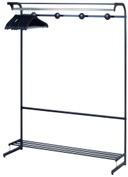
コートハンガー B ブラック JAN 047927