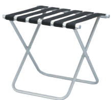
RKA-410 JAN 104897